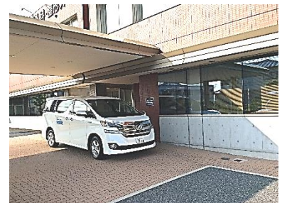
【前原外科・整形外科】