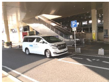
【前後駅(南ロータリー)】